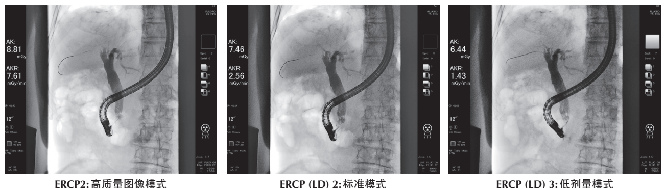
Fig.4 各模式下的画质比较 (胆总管结石病例)