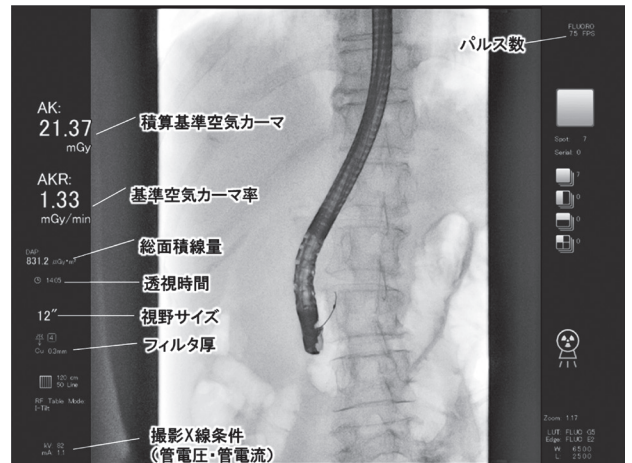
Fig.2 透视监视器上透视条件的参数

对于胆胰系IVR的患者，其X射线入射面射线量大约为10~20 mGy/min。在心血管诊疗中关于放射线辐射的指导方针中，明示了决定中止继续检查的阈值为不高于2Gy 7) 。另外，在医疗放射线指导方针2006中设定了放射线诊疗中的X射线剂量减少目标值为不高于25 mGy/min 8) 。检查时间较长时，需要在把握检查中的累计辐射剂量的同时，应对检查。