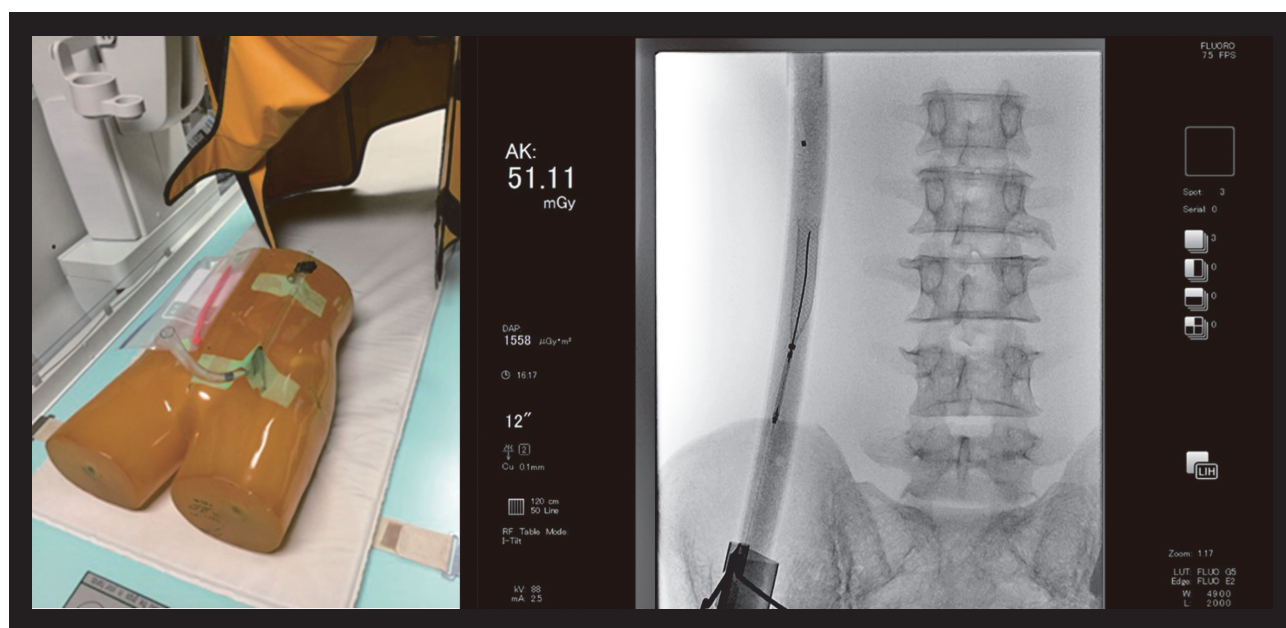
Fig.3 本中心使用体模进行的SCORE PRO Advance评价

另外，作为对图像质量产生影响的受检者方面的因素有体厚、肠道气体的量和位置、呼吸的深度和次数。体厚越大，肠道气体越多，与关注区域重叠，图像质量越模糊。而且，如果呼吸变深，次数变多，则关注领域和器具的残影增多，识别不充分。在这种情况下，有必要根据需要切换到高图像质量模式，或者提高帧速率。